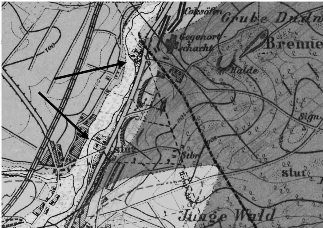
Vergrößerter Ausschnitt aus der GK 25, Blatt Dudweiler (Berlin 1875). Die Pfeile zeigen auf die Lage der beiden ehemaligen Alaunhütten.