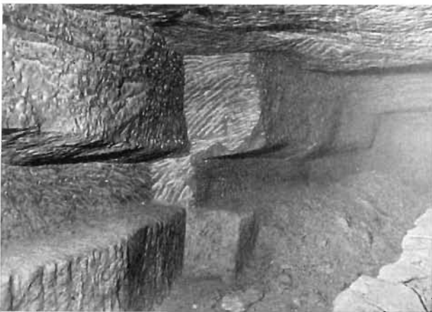
Bild 7. Strebbau der Periode „Saur“ bei Pkt. 226 im Stollen im Blauwald

So großzügig die Arbeiten aufgenommen worden waren, wurden sie bei völliger Ergebnislosigkeit ebenso schnell wieder eingestellt.