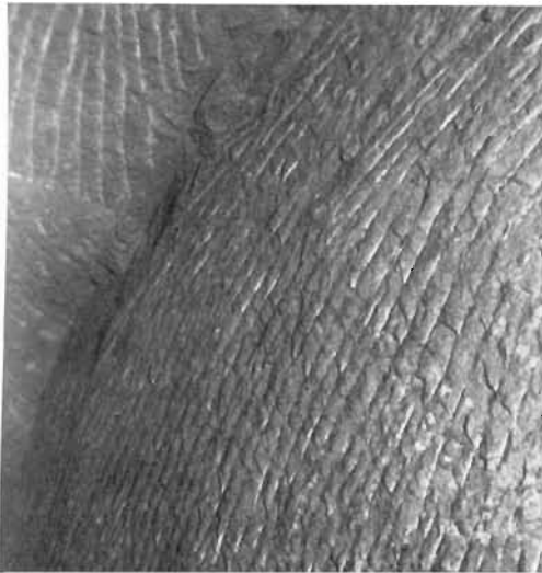
Bild 6. Rechter Seitenstoß der Periode „Saur“ mit sehr langen durchgehenden Spuren der Schlägel- und Eisenarbeit bei Pkt. 37 bis 38 im Stollen im Nahtenkeller

(Bild 7). Wie schon betont, erfolgte die Arbeit ausschließlich mit Schlägel und Eisen. Es läßt sich weiter erkennen, daß nach der Einteilung des Strebs wahrscheinlich 5 bis 6 Hauer gleichzeitig beschäftigt waren.