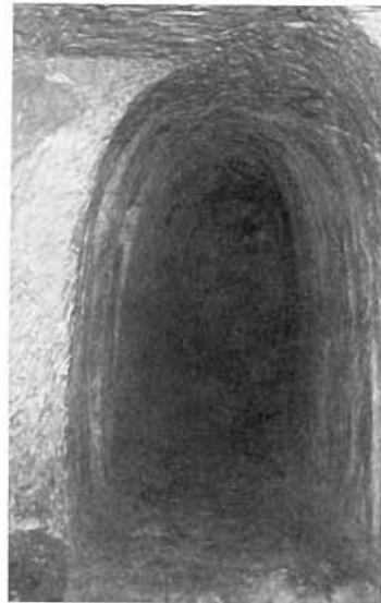
Bild 8. Gerundeter Streckenquerschnitt der Periode „Paulshoffnung“ bei Pkt. 12 im Limburg-Stollen

Soweit noch unverritzte Erzmittel anstanden, wurden diese durch relativ regelmäßig angelegte Haupt- und Feldstrecken aufgeschlossen und im Strebbau bei 0,6 bis 0,8 m Höhe gewonnen. Am Liegenden wurde unterschrämt und das Gestein durch an der Firste angesetzte Schüsse hereingewonnen. Weiteres Gezähe waren Keile und Brechstange.