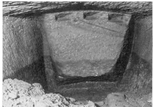
Bild 3. Mittelalterlicher Ortsstoß bei Pkt. 193 im Stollen im Blauwald

Sehr charakteristisch ist die geringe Arbeitshöhe von nur 0,6 bis 0,8 m, die auch in den ausgesprochenen Strecken der Blütezeit nie überschritten wird. Der Abbau sowie der Streckenvortrieb erfolgen in genau gleicher Weise in einem fast nur in der Breite (von 0,8 bis 5 m) variierten Schema. Es wird zunächst mit Schlägel und Eisen ein rechter und linker Seitenschram angelegt, denen ein Sohlschram folgt. Dann werden an der Firste Löcher in Keilform hergestellt (Bild 3). In diese werden die relativ kleinen Keile eingesetzt und der umschrägte Block damit hereingetrieben. Als letzter Arbeitsgang wird wieder mit Schlägel und Eisen der Stoß gesäubert.