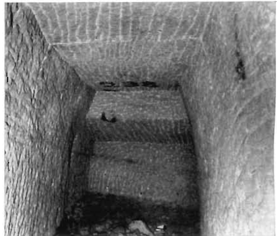
Bild 5. Ortsstoß der Periode „Saur“, Pkt. 238 im Stollen im Blauwald

Sicheres Merkmal der Strecken ist ein ausgesprochen scharfer Türstockquerschnitt mit glatten Seitenstößen und betonten Kanten (Bild 5). Alle sichtbar verbleibenden Flächen wurden sorgfältig nachgearbeitet und zwar so, daß jede neue Spur exakt in der vorhergehenden