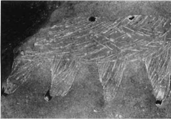
Bild 4. Reste einer Keillochreihe mit Keilabdrücken

durch die sehr dichte Anlage von Schächten, während Abbau nur stattfindet, wenn Vererzungen direkt angefahren werden. Die Abbaufächen sind relativ klein. Daraus entwickelt sich, im einzelnen bisher kaum nachzuweisen, eine Vergrößerung der Abbauhohlräume mit Ausweitungen in höffige Richtungen bis zu Systemen in der Blütezeit, die regelrechte Suchstrecken aufweisen und teilweise reinen Hoffnungsbau darstellen. Bei diesen weisen die Schächte größere Abstände auf, die Grundflächen der Systeme werden teilweise sehr groß, wobei der Abbau gleichzeitig in mehreren Niveaus stattfinden kann.