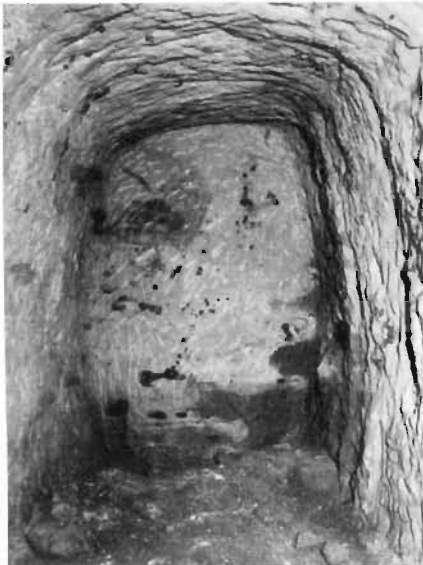
Bild 2. Römischer Ortsstoß im Unteren Emilianusstollen. Der Keil-Eindruck findet sich etwas oberhalb zwei Drittel der Höhe in der rechten Hälfte des Ortsstoßes

war. Wie ein Keil-Eindruck in Bild 2 vermuten läßt, erfolgte der Ausbruch, von einem Keileinbruch beginnend, über den gesamten Querschnitt. Richtung und Längen der Spuren entsprechen völlig dem Bild, das bei aufrechter Haltung bei der Arbeit mit der Keilhaue zu erwarten wäre. Für eine Schlägel- und Eisenarbeit sind die Spuren zu grob und nicht dicht genug, außerdem