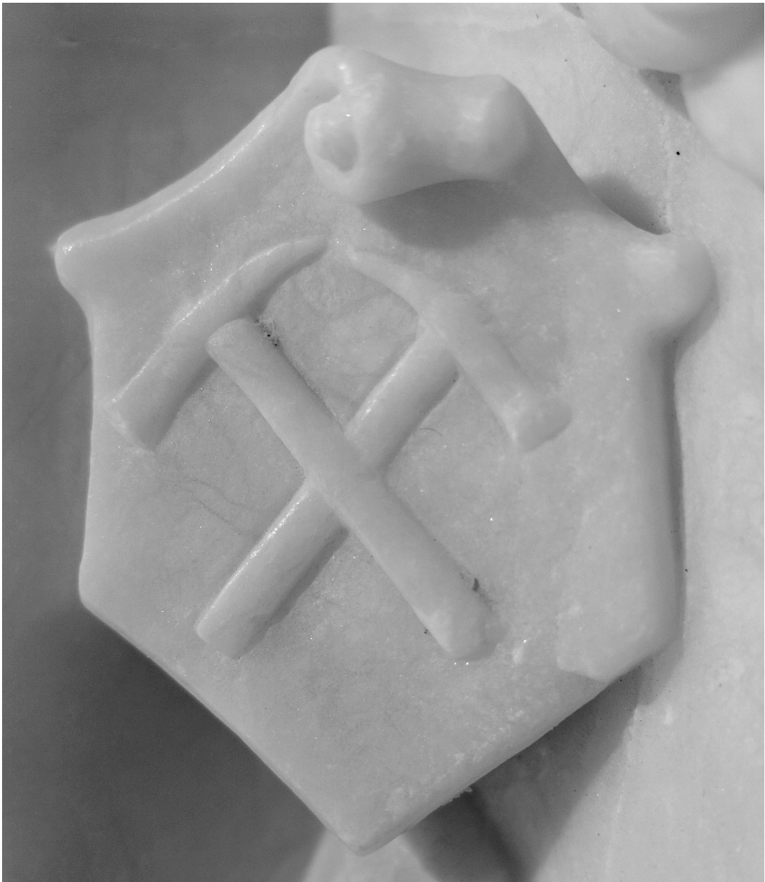
Ausschnitt aus dem Alabaster-Relief, der die Werkzeuge im Schild zeigt.

Zuletzt stellt sich die Frage, warum LIEBERTZ in seinem Werk dieses Relief überhaupt nicht erwähnte. Man darf vermuten, dass LIEBERTZ wohl solche Kenntnisse über die Herkunft besaß, dass er das Relief nicht mit der Azurit-Gewinnung von Wallerfangen verknüpfen konnte.