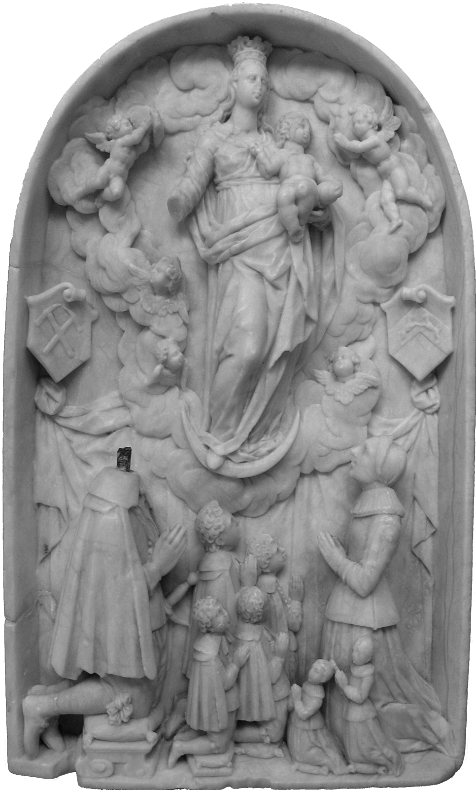
Gesamtansicht des Alabaster-Reliefs mit dem Schild links oben.